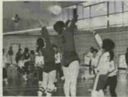
ハッスルプレーの繰出した女子バレー

南中学校と吉田小学校の体育館に千五チーム・二百五名が参加。トリス、スパイクと元気な声があふれにこたました。熱の入った試合が繰り広げられました。