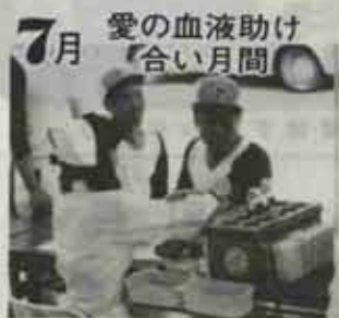
7月 血液助けの月間

あります)により、教育委員会に申込み下さい。定員(百名)以上の申込みがあった場合は、選考後ハガキで通知をします。