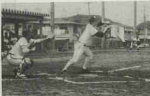
第1回目の町長杯獲得を目ざして熱戦を展開

かつて日廣高松球場で野球ファンを魅了した、水巻町長杯軟式野球大会が十数年ぶりに復活しました。 日廣閉山により中止されていましたが、このほどスポーツが盛んとなり、チーム数も増えたため、お互いの親睦を図るために再開されました。 第一回目の大会は、六月九日・十六日の二日間、十三チームが参加して吉田・猪熊の両グラウンドで試合が行われ、水巻役場と入江興産が決勝で対戦、2対2の同点の末、判定戦で水巻役場が第一回目の優勝を挙げました。