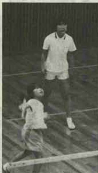
懸命に羽根を追う。チビっ子も参加してのバドミントン