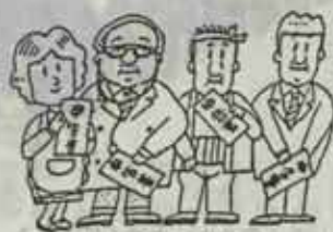
税の申告はじまる

住民税と国民健康保険税の申告の時期がやって来ました。次の日程で申告と納税相談を行いますので、該当される方は、必ず申告をしてください。 なお、前号で譲渡所得の申告を三月四日・五日・六日となつていましたが六日は行いませんのでご注意下さい。