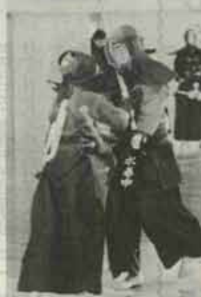
烈しい闘(つば)競合を展開一気魄の入った試合が繰り上げられました。