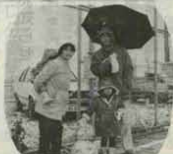
寒さにふるえながら 観賞も大変だ。