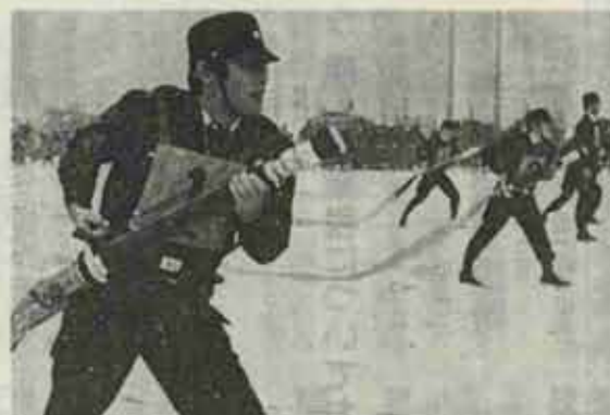
白い息をはずませ 一糸乱れぬポンプ 操作の実技をする 水巻町消防団