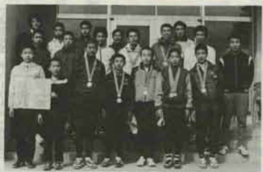
大会新記録で四年ぶりに優勝を果した水巻チームの選手。