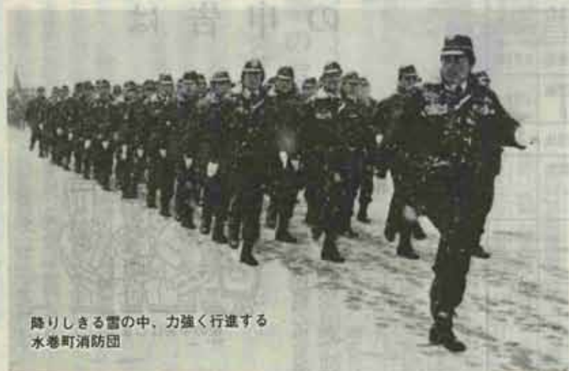
降りしきる雪の中、力強く行進する 水巻町消防団